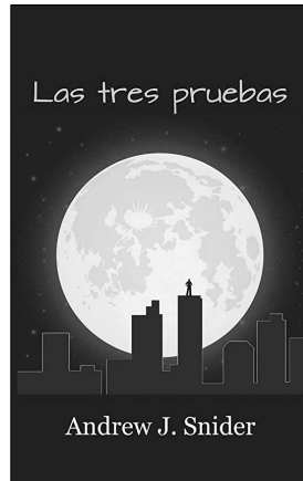
Las tres pruebas