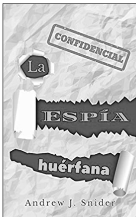
La espía huérfana